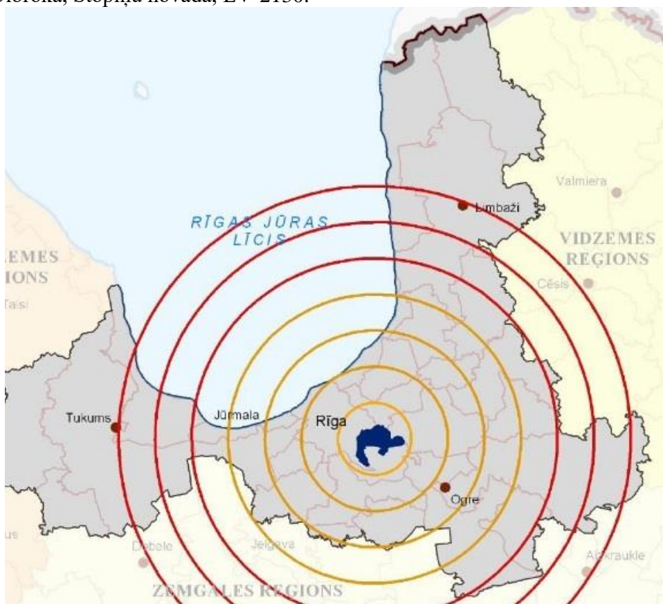
1.1. att. Stopiņu novada atrašanās vieta 1

Pašvaldības Aģentūra (turpmāk PA) „Stopiņu ambulance” organizē kvalitatīvu veselības aprūpi un sabiedrības veselības rādītāju uzlabošanu novadā. Tās kompetencē ietilpst pašvaldības veselības politikas mērķu realizācija. PA „Stopiņu ambulance” atrodas Institūta ielā 20, Ulbrokā, Stopiņu novadā, LV-2130.